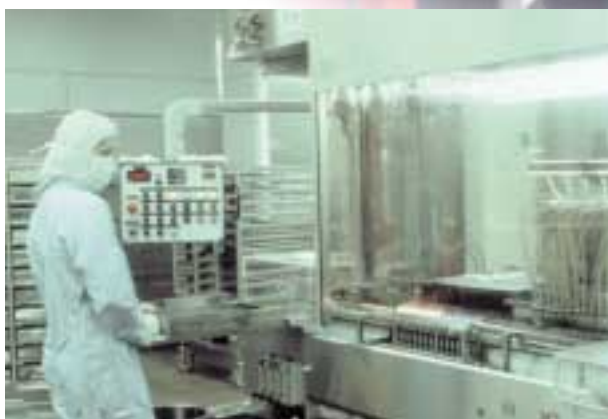
Чистые помещения GEA для различных стандартов чистоты